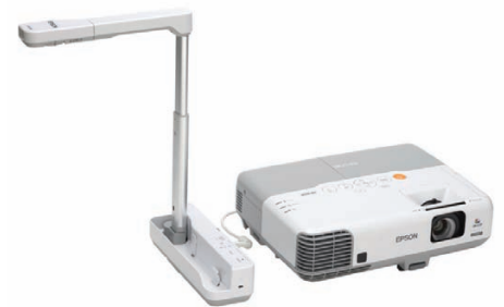
Prostřednictvím vizualizéru ELP-DC06 můžete sdílet trojrozměrné předměty