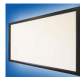
Frame Budget – Typ D, přední projekce, formát 4:3