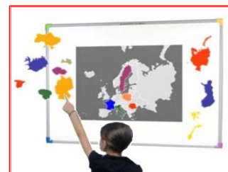
NOVINKA - TouchBoard