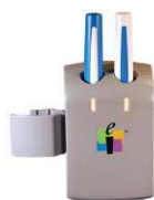
nabíječka s perem II