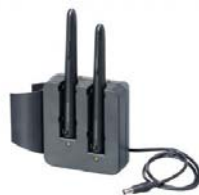
nabíječka s perem